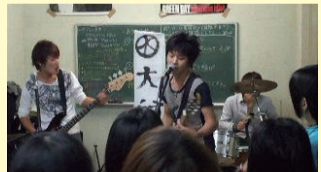
▲学生時代に友人とバンド活動に取り組んだ日々