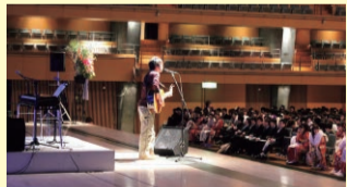
▲静岡市成人式2011 @グランシップ大ホールに出演