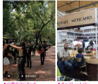
▲公園のマリアッチ ▲チョコレートパー ▲JAZZ Club

プロレスを見にいった話。メキシコではプロレスの事をルチャリブレと云い凄く人気です。