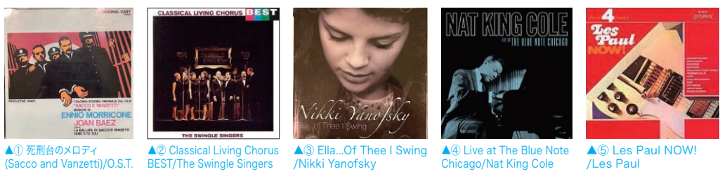
▲① 死刑台のメロディ (Sacco and Vanzetti)/O.S.T. ▲② Classical Living Chorus BEST/The Swingle Singers ▲③ Ella...Of Thee I Swing /Nikki Yanofsky ▲④ Live at The Blue Note Chicago/Nat King Cole ▲⑤ Les Paul NOW! /Les Paul