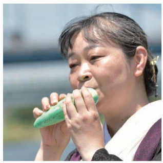
「思い通りに演奏できる!オカリナ上達のポイント50」 監修出版。神奈川県・東京を中心に演奏活動しています。...