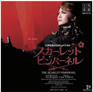
スカーレット・ピンパーネル (2008年 宝塚歌劇団 星組大劇場公演ライブCD)

肌も髪の色も違います。それぞれの個人の資質を受け入れ尊重することが大切。音楽も同じで、それぞれのジャンルを尊重して表現していきたいと私は思いました。つまり、音楽の存在自体に人種、言葉、国境、性別という境界線はない。それが私の言う本当の意味で差別を超越することなのです。