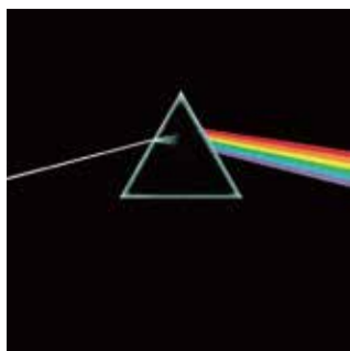
▲キーボード奏者リチャード・ライトの「大胆でしかもシンプルに」という、デザインチーム・ヒプノシスへのリクエストによるジャケット・デザイン。The Dark Side Of The Moon(邦題:狂想)(1973)