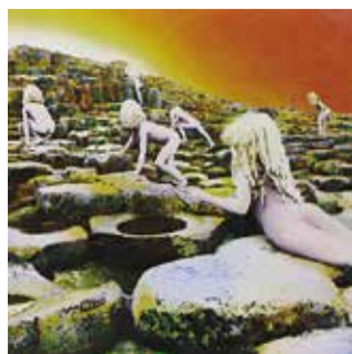
▲レッド・ツェッペリンの第5作アルバム。見開きジャケットの表全面を使って、11人の裸の子供たちが岩場を登ってゆく情景が描かれている。Houses of the Holy(邦題:聖なる館)(1973)

ヒプノシス(1968年~1983年)は、イギリスのデザイン・アートグループ。それまでのレコードジャケットのデザインは、宣伝用のパッケージ・デザインとして捉えられていたが、ヒプノシスはアートとしてジャケットのデザイン性を高めたと言われています。