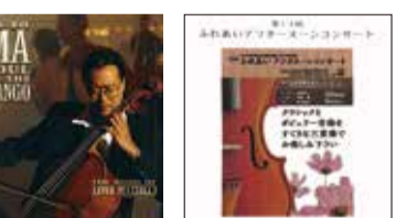
▲④Soul of the Tango/Yo-Yo Ma