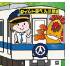
▲タイムトラベル小泉線(大泉町ご当地ソング)桂宏美が書きおろしたご当地応援歌で地元小泉線をモチーフにした楽しいソングです。iTunesでもご視聴できます。