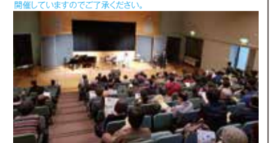
▲第1回 元住吉ミュージック・フェスティバルは2019年4月12日に開催されました。第2回 元住吉ミュージック・フェスティバルは2023年4月8日に開催されます! 入場無料!

●コロナ感染防止のため中止となる場合があります。またコンサート会場は換気のため窓・ドアなど一部開放しながら開催いたしますのでご了承ください。