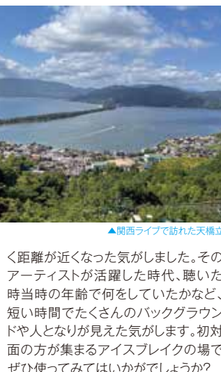
▲関西ライブで訪れた天橋立

気持ちは共有したいという思いです。いつもは「どこから来て、どういう活動をこれまでして、演奏のスタイルは...」ということをお話するのですが、その日はおナーナからとあるお題を出されました。「今までで一番影響を受けたアーティストを一組だけお話しください」