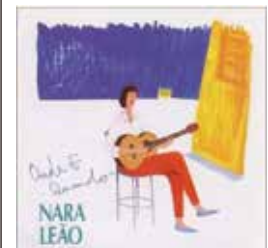
▲Onde E Quando(いつかどこかで) / Nara Leao

Light Music(軽音楽ファンの集い) ●担当：藤田 順治 ジャズのスタンダード曲をボサノヴァで