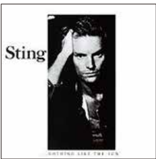
▲オーソドックスなフォートのタイトル。素敵なモノトーンの写真。それを白地にレイアウトした飾り気のないジャケット。グラフィック・デザインとは「レイアウトなんだなあ」とあえて納得するのだ。

40になる頃だった。仕事場に流す音を探していたらイギリスのロックバンド、ポリス(The Police)のベーシスト兼ボーカリストのステイングが独立したと聞いた。