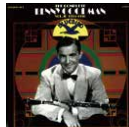
▲Complete Benny Goodman Vol.2 / Benny Goodman