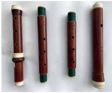
▲この度仲間に加わった、J.テナーモデル

あり、価値を換算すると曲集1つでお屋敷が建ってしまうほどの高価なものだったようです。流行歌を集めて、豪華な装飾を描き加えた楽譜は、見ているだけでも美しく幸せな気持ちになります。