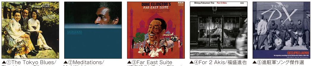
▲①The Tokyo Blues/The Horace Silver Quintet ▲②Meditations/Mal Waldron ▲③Far East Suite(極東組曲)/Duke Ellington and his orchestra ▲④For 2 Akis/福盛進也 ▲⑤進駐軍ソング傑作選

しました。「日本のジャズポピュラー史(戦後編)」という貴重なレコードから当時人気を博していた3大人気コンボのそれぞれの楽曲を堪能させていただきました。