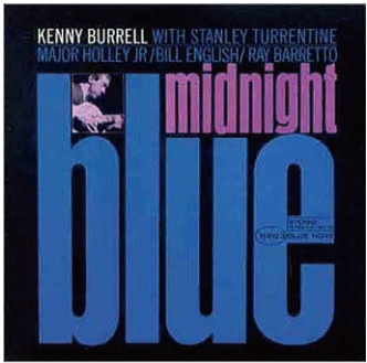
▲midnight blue/Kenny Burrell

元住吉に来る前、長い間、横浜の馬車道界隈で働いていました。あの辺りはJRの線路を挟んで、海側と陸側で随分雰囲気が違います。