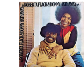
▲Roberta Flack & Donny Hathaway

戻されました。学校から停学処分のお知らせが届いたので。最初からこうなることは解っていたので、お世話になった先生たちに深くお詫言をして、自由な時間を満喫しました〜! 昼まで寝てからレコードを何回も聴いたり、本を読んだり、ふらっと散歩に出かけたり…漠然とはしていましたが、私は自分の進みたい道がスッキリと見渡せたのでゴキゲンでした。私の学校は規則が厳しくて音楽活動には向いてなかったけど、だからこそ道が見えてきたのかもしれない。私は友達がいる学校が大好きでしたが、その友達も高2の後半にもなると進学に向けて準備が始まりました。でも私はみんなと違った準備をすることになりました。だって、いろんな所から専属契約の話が舞い込んだんだもん。スッキリと見渡せる道へ一歩踏み出せるのかなあ…。