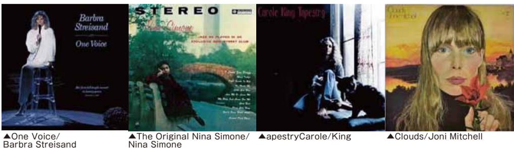
▲One Voice/Barbra Streisand ▲The Original Nina Simone/ Nina Simone ▲apestryCarole/King ▲Clouds/Joni Mitchell