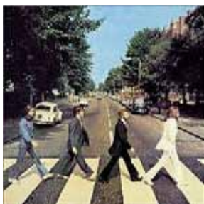
▲今回演奏した「Something」が収録されたアルバム

また、メロディー楽器だとしてもハーモニーやリズムに対して理解と反応がどれだけ大事なことになるのか、ということも改めて再認識することが出来ました