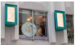
▲①現在のポロントール