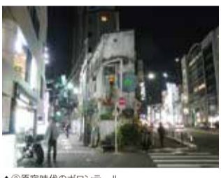
▲②原宿時代のポロントール