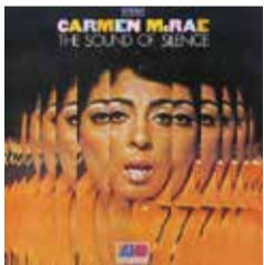
▲The Sound Of Silence/Carmen Mc Rae Atlantic P-6087 * (1916)は作詞、作曲の年号

さて、お話を若い日に戻しましょう。東芝EMIとお別れをした私は表舞台から消え、その後はスタジオワークと作詞家をしていました。高校生からの業界なので、EMIを辞めたという仕事を回してくれる方が居て本当に助かりました。私がスタジオで唄う仕事は、大きく分けて四つでした。CM、ガイドボーカル、コーラス、カラオケ