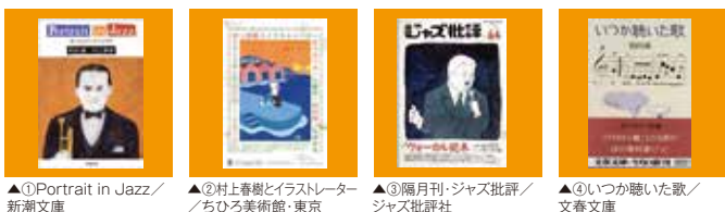
▲①Portrait in Jazz/新潮文庫 ▲②村上春樹とイラストレーター/ちひろ美術館・東京 ▲③隔月刊「ジャズ批評」/ジャズ批評社 ▲④いつか聴いた歌/文春文庫

ジャズのスタンダードとなった歌100曲を記した「いつか聴いた歌」(写真④)は、和田さんのLPレコードの遍歴による随想です。自分は世界一のシナトラファンだと自負されているように、フランク・シナトラが歌う曲が数多く選曲されています。楽しい内容で、この図書をもとにいつかジャズ・スタンダード曲のDJが企画できればと考えています。