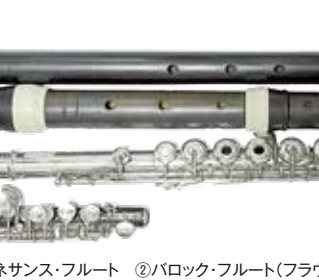
▲くじら座のメンバーが演奏中

てくじら座のメンバーは、それぞれでそれぞれの活動を続けることを余儀なくされている。ユニットでのライブ活動を求める声をいただく度に、とても申し訳ない悔しい想いになるが、今の活動は決して後ろ向きなものではない。一人でステージに立つからこそ気づけること、成長できることもあるはずだ。すぐには実現できないかもしれないが、いつかまた二人で音を鳴らす日、そして元住吉でライブができる日を楽しみに、僕も僕でできることを進めていくつもりだ。先日、地元の焼津市で大きなステージに立たせていただいた。このご時世でも、必要としてもらえる場があるのは本当に嬉しい。どんなときも、どんなス