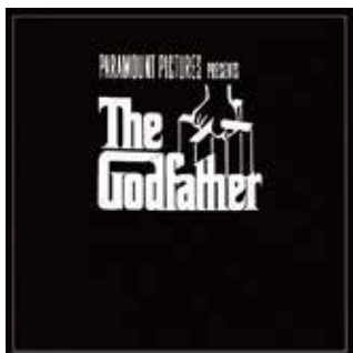
▲ゴッドファーザー／オリジナル・サウンドトラック盤 音楽 ニーノ・ロータ／監督 フランシス・フォード・コッポラ

私は趣味ではあるが友人の協力のもとでアマチュア映画を創っている。念願の夢がこの歳になってようやく叶ったのだ。そして映画には音楽がつきもので私の映画にもジャズピアニストの西郷正昭氏に音楽をお願いしている。そんな団塊の世代にとって外せない映画音楽といえば1972年公開の「ゴッドファーザー」である。