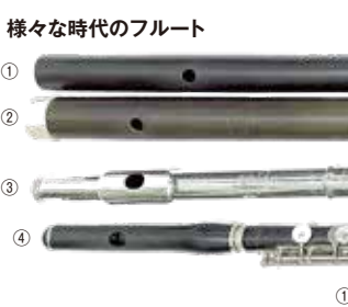
①ルネサンス・フルート ②バロック・フルート(フラウト・トラヴェルト) ③モダン・フルート ④ピッコロ

私とフルートの最初の出会いは幼稚園に通っていたころに遡ります。毎年、「音楽週間」というイベント週間があり、普段以上に歌う時間が多く取られていたり、それぞれ担当の打楽器を決めてピアノに合わせて演奏したり、父母会の合唱の発表があったり、プロの音楽家の方によるコンサートがあったり、とにかく音楽に溢れた1週間だったことをよく覚えています。その音楽週間に合わせて来園してくださった音楽家の中にフルート奏者がいらっしゃり、演奏を聴いたことが私のフルートとの初めての出会いでした。今でこそ幼児用フルートが開発され、とても小さなフルーティスが増えていますが、当時はありませんでしたので幼稚園生がフルートを吹くのは物理的に無理でした。大きくなったらやりたいな、というのが私の夢になったのです。とは言え、演奏を聴く機会もほとんどなくその後数年フルートへの憧れはほとんど忘れ去ってしま