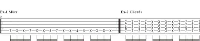
Ex-1 Mute Ex-2 Chords

7th、6thで、コードカッティングはE9になっています。このような16beatの場合は音価(音の長さ、アクセント)が非常に重要になってきますが、音価を気持ち短めの意識で弾いていくと良いかもしれません。こういったパターンにリズム隊(ドラム、ベース)が絡んでくると、最高のリズムの完成です。是非友達同士でアイデアを出し合って色々試してみてくださいませ! というわけでまた次回!