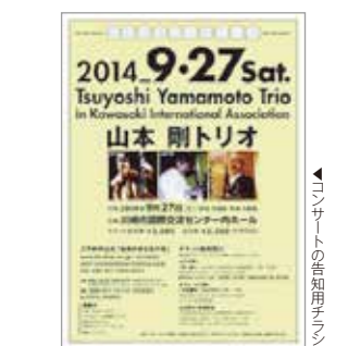
▲コンサートの告知用チラシ