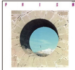
▲② Mint Jams/Casiopea