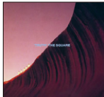
▲① Truth/the Square