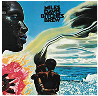
▲Bitches Brew / Miles Dewey Davis ジャケットの画家はマティ・クラウワーイン。横尾忠則も傾倒したとされるアーティスト。

ジョン・コルトレーンの「至上の愛」に始まり、ポップ・ディランの詩の面白さ、フォークからロックといった幅広い音楽を聴くようになりました。洗練された美しさに対し、情念溢れる表現や土俗的な表現などにも興味が出てきました。様々な表現に関わること創作への世界がグンと広がりました。