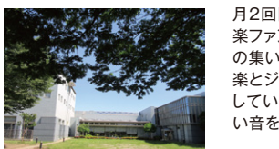
レセプションルーム

月2回開催しているレコードコンサート「軽音楽ファンの集い」Light Music」&ジャズファンの集い「Jazz Date」は暫くの間月1回「軽音楽」とジャズを聴くプログラムに変更して開催しています。デジタルには刻まれていない優しい音をレコードのアナログサウンドで探して見