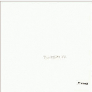
▲The Beatles / The Beatles ジャケットはイギリスの画家リチャード・ハミルトンとポール・マッカートニーがデザイン。

「レコードは、ジャケットが面白いと中身も面白い」、そんな見方はビートルズから始まりました。そして、そのカルチャーショックによって、自分なりの生き方がぼんやりと見えてきたんです。