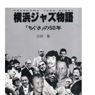
▲①横浜ジャズ物語「ちくさ」の50年