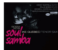
▲①Bossa Nova Soul Samba/Ike Quebec

そうそう、ちょうどいき出版で「川崎市の100年」って写真集を出版しました。数量限定ですので、興味のある方は早めに入手した方がよろしいかと思