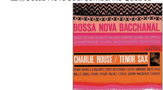
▲②Bossa Nova Bacchanal/Charlie Rouse