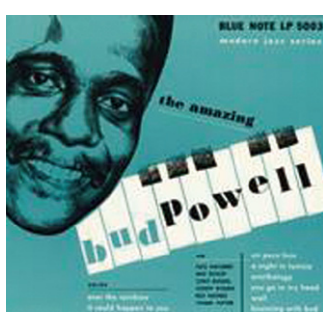
▲②Blue Note 10"LP 「the amazing Bud Powell」