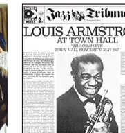
▲⑤Town Hall Concert/Louis Armstrong