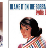
▲⑤Blame It On The Bossa Nova/Eydie Gormé