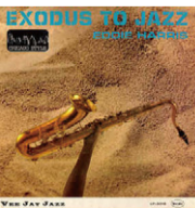
▲②Exodus To Jazz/Eddie Harris