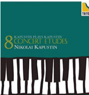
▲②8 concert etude/N. Kapustin