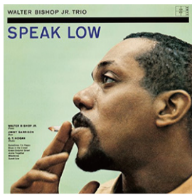
▲①SPEAK LOW/WALTER BISHOP JR. TRIO

音楽に限らず、スポーツでも何でもよいのだけれど、皆さんには、「あれれ〜、今日の俺、どうしちゃったんだろう?」なんて経験はありますか?残念ながら私はありません。楽器はやっていないのですが、スポーツはボルダリングを数年やっていて、最近絵画教室に通い始めたのですが、どちらも、上手く行って「実力通り」、殆どの場合は「今、一歩」ってところで、絵画なんて、左手で描いた方がマシなんじゃないか、と思うくらいです。