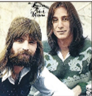
▲①Loggins & Messina/Loggins & Messina