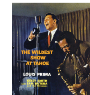
▲④The Wildest Show At Tahoe/Louis Prima