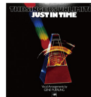
▲③Just In Time/The Singers Unlimited