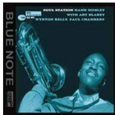
▲ソウル・ステーション/ハンク・モブレイのリメンバー

お店(花屋をやってます)ではいつも軽いジャズを流していますので、暇な時に聴きにきて下さい。