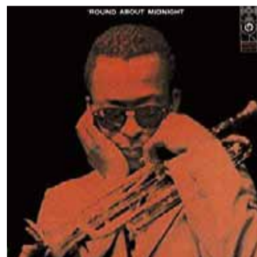
▲マイルス・デイビス ラウンド・アバウト・ミッドナイト+4