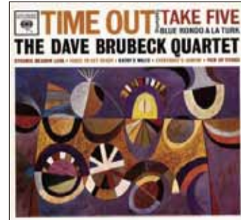
▲TIME OUT/THE DAVE BRUBECK

私がサクソに会ったのは中学生の時分で、少し体格が大きかったことから(当時は今のぼっちゃりとは違い、スラッとした体型でありました-笑-)少し大きいサクソだよと、テナーサクソを担当。本当はアルトサクソを担当したかったのですが・・・やるからにはモノにしてやろうと意気込み、熱心に練習を重ねていました。当時の吹奏楽部の顧問の先生が、元バンドマンで、ピンクレディーなどのバックバンドをしていたり、またジャズが好きで、「Take Five」のPaul Desmondやアーティストは失念しましたが、「In a sentimental mood」などをよく聞かせてもらっていました。その時はこんな音楽もあるんだなあ、という程度にしか思っておらず、特に興味を示しません